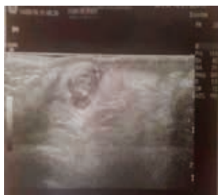
Figura 1. Ecografia emiscroto sinistro: larva di D. repens .

Per il pediatra generalista diagnosticare e gestire le forme extraintestinali di elmintiasi non è semplice, sia per le manifestazioni cliniche proteiformi sia per l'assenza di vermi e uova nelle feci. E anche gli infettivologi spesso non hanno le competenze specialistiche appropriate.