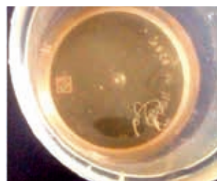
Figura 2. Larva L3 (cm. 10) di D. repens estratta da cisti scrotale in bambino di 11 mesi.

struttura filiforme vivacemente mobile all'interno di una formazione cistica anecogena senza rapporti con il testicolo (Figura 1). Consultato chi scrive, veniva posta diagnosi di infestazione da Dirofilaria repens . La delicata sezione della piccola massa asportata permette-