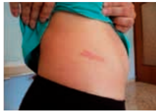
Figura 4. Bambino di 7 anni: larva migrans cutanea al fianco destro.